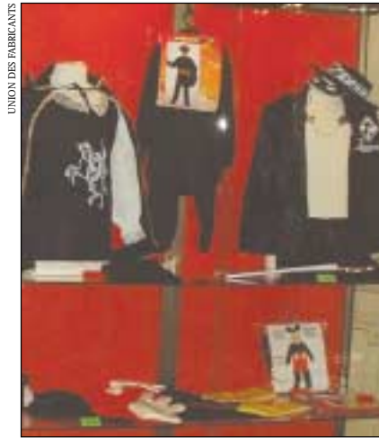
Aujourd'hui, la contrefaçon ne se limite plus aux produits de luxe.

pays. Enfin, la coopération internationale doit être renforcée tant au niveau européen qu'au niveau mondial. Car chacun le sait, la contrefaçon tend désormais à s'organiser à l'échelle internationale. Ayant dépassé maintenant le stade « artisanal », elle alimente de véritables organisations criminelles. Car un tel trafic est susceptible de rapporter davantage d'argent que le trafic de stupéfiants. Chiffres cités par Nicole Fon-