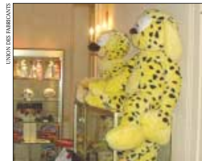
UNION DES FABRICANTS