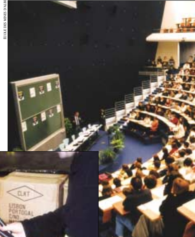
ÉCOLE DES MINES D'ALBI

Les élèves ingénieurs et les étudiants en management seront maintenant sensibilisés à la propriété industrielle.